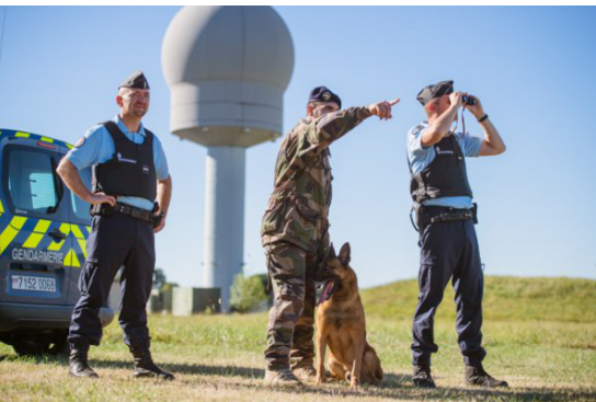
La gendarmerie de l'Air assure la sécurité des bases aériennes militaires françaises, implantées dans le monde.