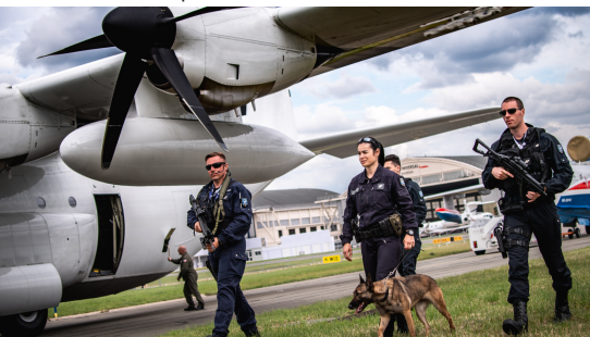
La gendarmerie des Transports Aériens est quotidiennement engagée sur les sites aéroportuaires de métropole et d'outre-mer.

Outre le maintien des objectifs initiaux de l'Amicale fondée en 1991, promotion du lien amical entre ses membres d'une part, et résilience du devoir de mémoire, tant sur l'histoire des FAGN que sur celle des hommes qui l'ont faites, d'autre part. Elle ambitionne désormais :